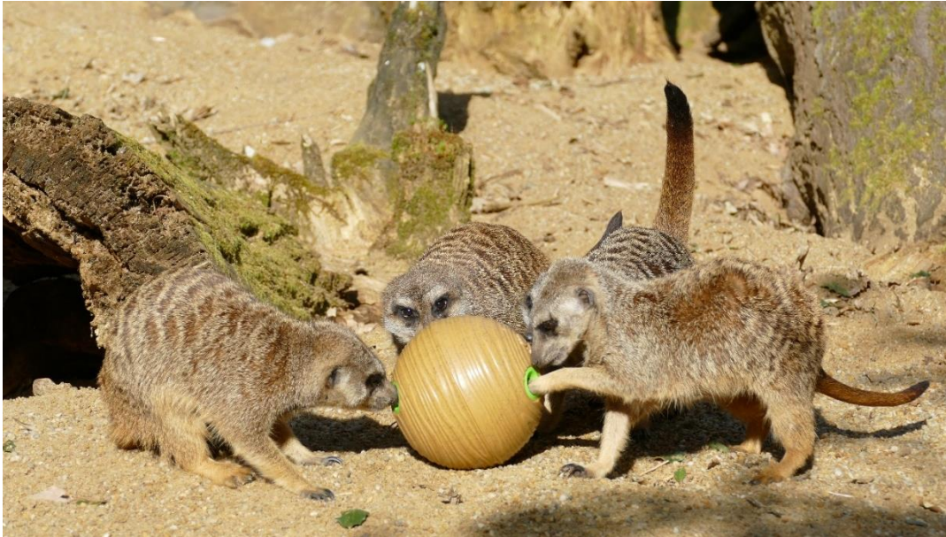
Exemple d'enrichissement par le jeu

Grille d'évaluation, plan d'action, répertoire comportemental, planning d'enrichissement... sont mis à la disposition des parcs de l'AFDPZ. Chacun pourra se les approprier, les enrichir et en améliorer les contenus, avec la perspective d'une mise en commun des informations clés, pour aller toujours plus loin dans la recherche du bien-être animal.