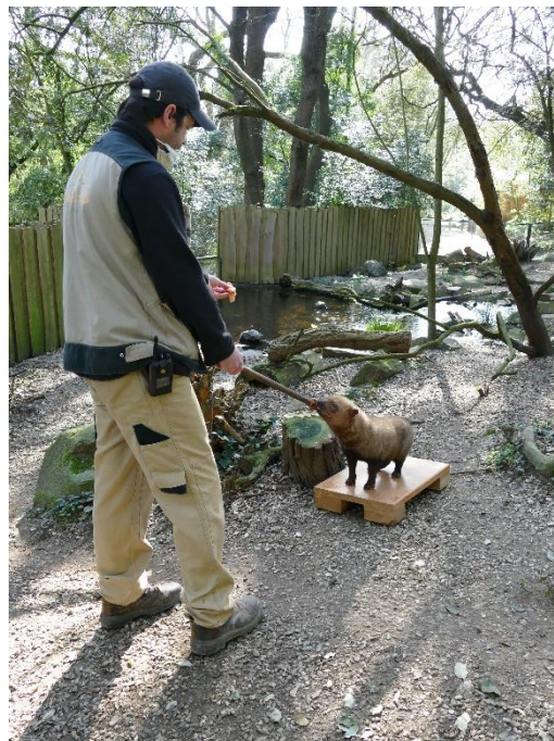
Exemple d'enrichissement par le training médical

Grille d'évaluation, plan d'action, répertoire comportemental, planning d'enrichissement... sont mis à la disposition des parcs de l'AFDPZ. Chacun pourra se les approprier, les enrichir et en améliorer les contenus, avec la perspective d'une mise en commun des informations clés, pour aller toujours plus loin dans la recherche du bien-être animal.