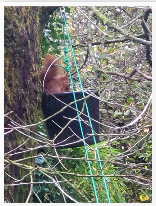
Ecureuil roux photographié au Zoo des Sables – Arbre sur lequel est fixé l'écuroduc secondaire.

Le mois suivant, les films et photos pris par la caméra montrent que, certainement attirés par le réapprovisionnement, les écureuils roux ont fait leur apparition dès les premiers jours suivant l'intervention. Empruntant les deux écuroducs jour et nuit, quotidiennement, deux écureuils roux ont pu être identifiés sur les clichés, différant par la couleur de leur pelage.