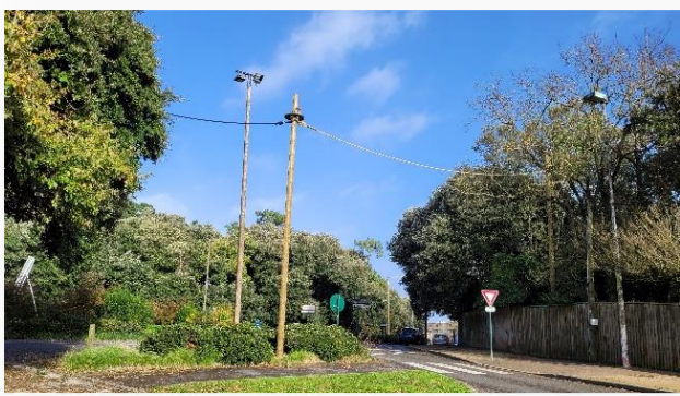
Ecuroduc situé au niveau du rond-point de la Rudelière.

Un écuroduc consiste en un cordage relié au niveau de chacune de ses extrémités à des poteaux, eux-mêmes reliés à des arbres par des écuroducs secondaires, formés de câbles élastiques. Le dispositif principal est installé à une hauteur de 8 mètres. Au sommet des poteaux, sont installées des mangeoires, réapprovisionnées tous les mois, dans un premier temps, afin d'inciter les animaux à emprunter ce nouveau passage. Des caméras permettent également de vérifier l'efficacité du dispositif.