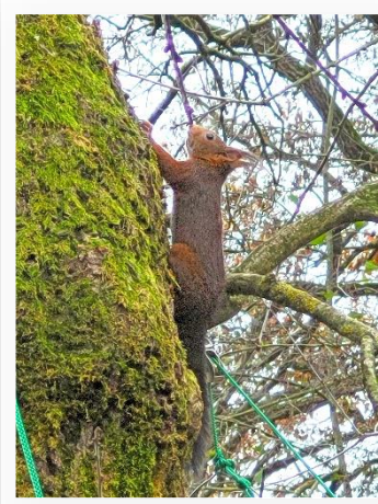
Ecureuil roux photographié au Zoo des Sables

Ainsi, le but du projet était d'établir un couloir écologique, permettant à la faune sauvage arboricole et plus particulièrement aux écureuils, de traverser la route en toute sécurité, afin de relier les espaces boisés de la Rudelière et ceux du Zoo des Sables. Dans cette optique, l'association COHAB, spécialiste de la mise en place d'écuroducs, a été contactée.